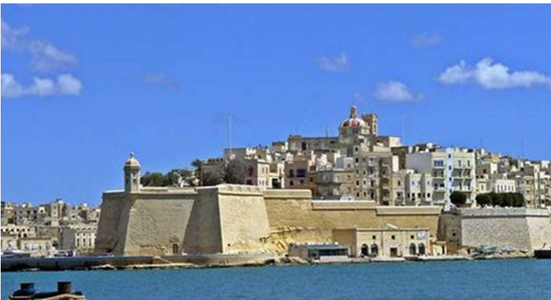
La Valette, le fort Saint Angelo