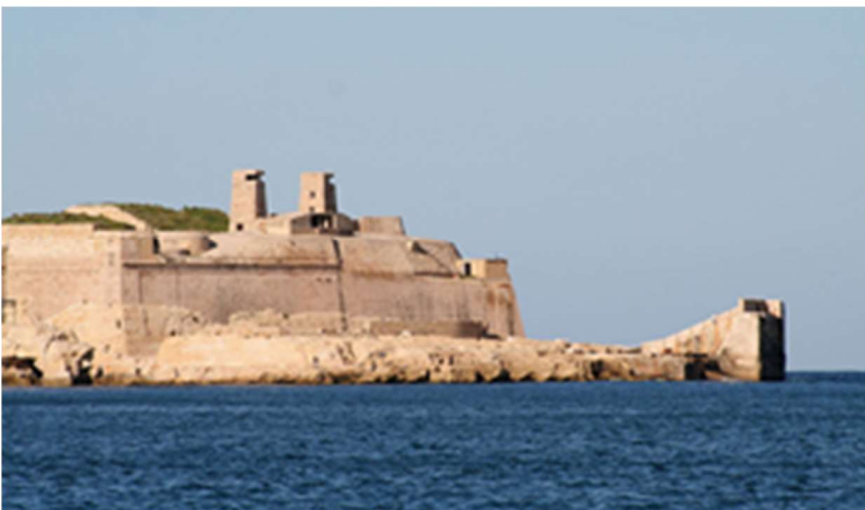
La Valette, le fort Saint Elme