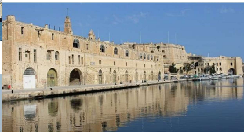
La Valette, le musée Maritime